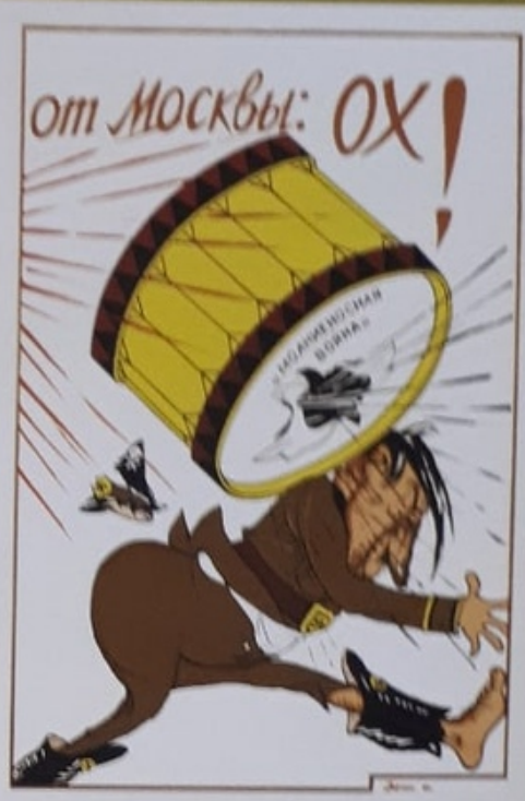
111 Виктор Дени. 1942 Viktor Deni 'Hoch', to Moscow - 'Ooh!', from Moscow! Moscow-Leningrad, 1942