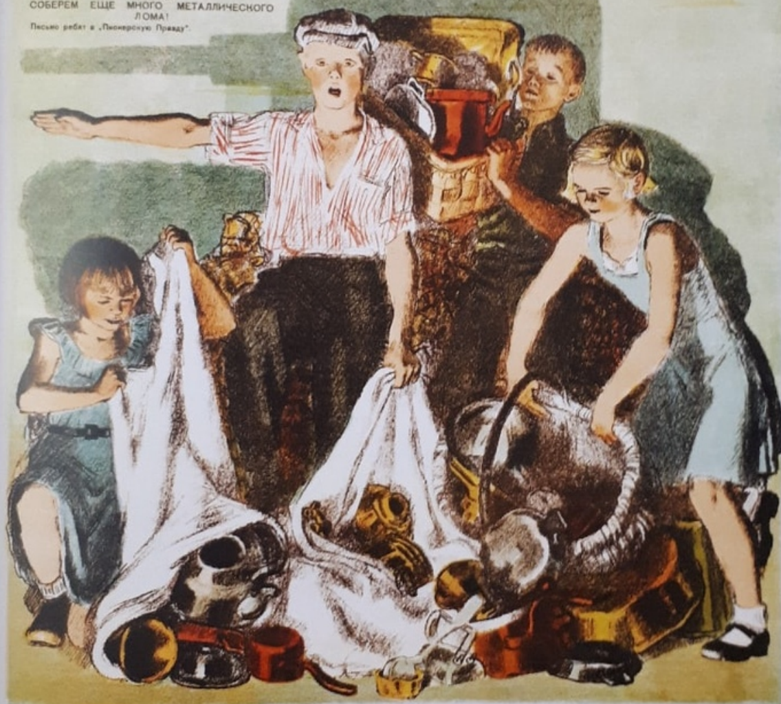
Алексей Пахомов. 1941 Alexei Pakhomov Hit the Fascists with Metal! Moscow-Leningrad, 1941