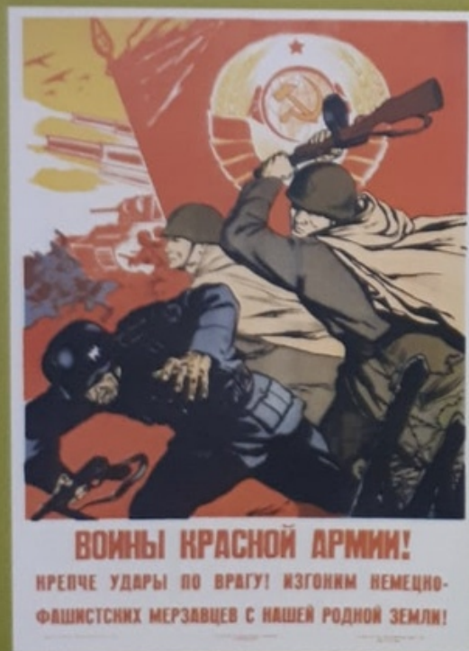
346 Владимир Серов, 1944 Vladimir Serov: Red Army Soldiers, Strike at the Enemy Harder! Let's Drive the German Fascist Scoundrels out of our Dear Land! Leningrad-Moscow, 1944