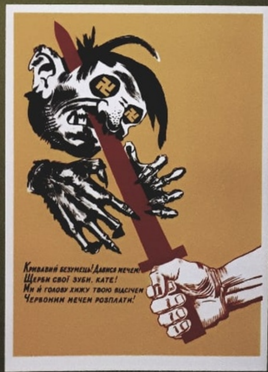
60 Георгий Клянченко. 1941