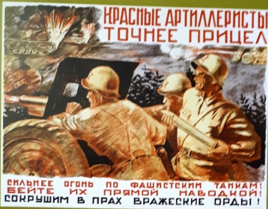
16 Александр Самохвалов. 1941 Alexander Samokhvalov Red Artillerymen, Aim True! Fire at the Fascist Tanks Harder! Leningrad-Moscow, 1941