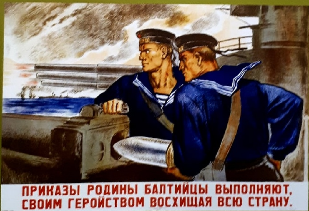
17 Владимир Серов. 1941 Vladimir Serov Baltic Navy Soldiers Execute the Orders of the Motherland Inspiring the Whole Country with their Heroism Leningrad-Moscow, 1941