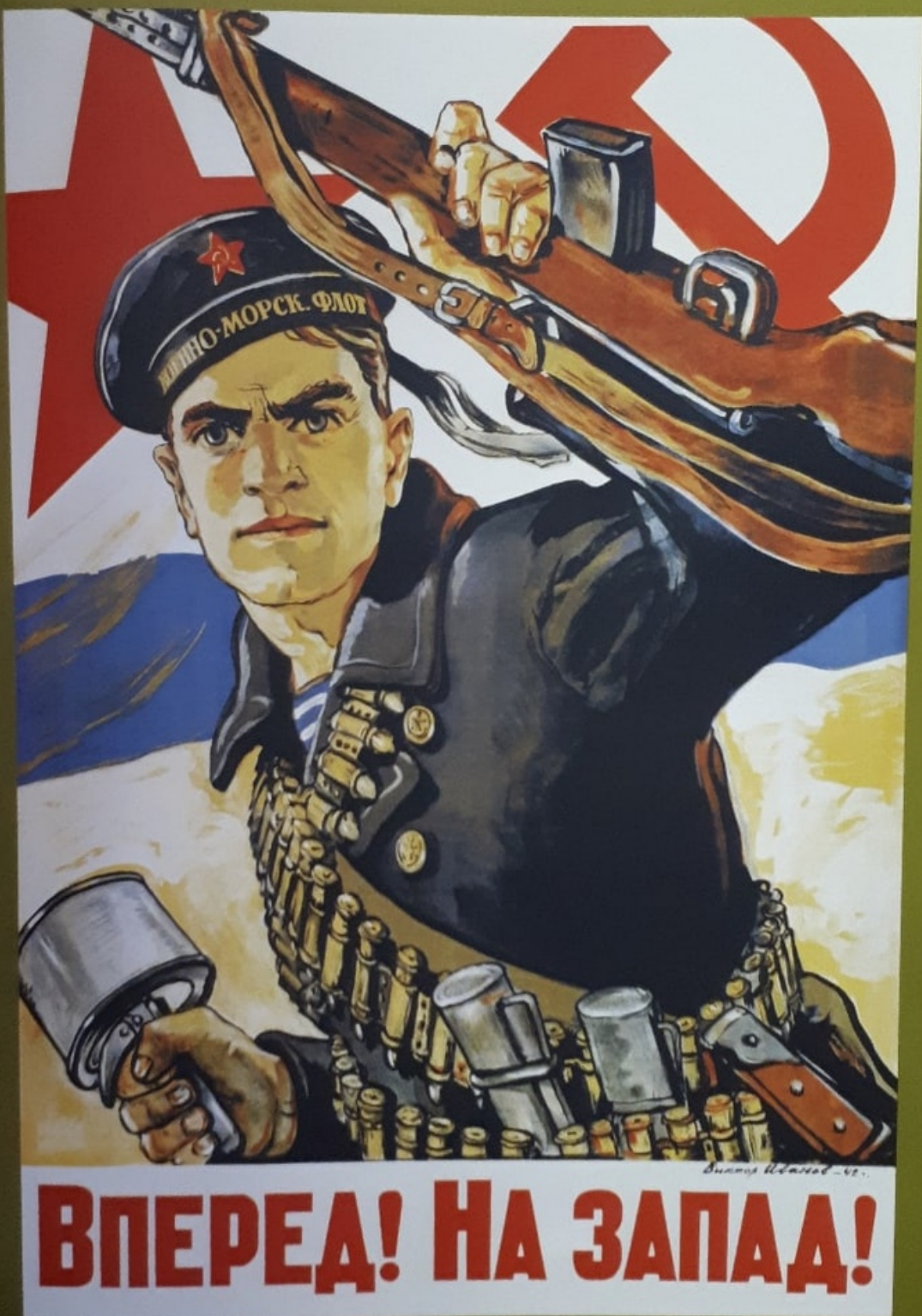
183 Виктор Иванов. 1942 «Вперед! На Запад!» Масло, Ленинград, 1942