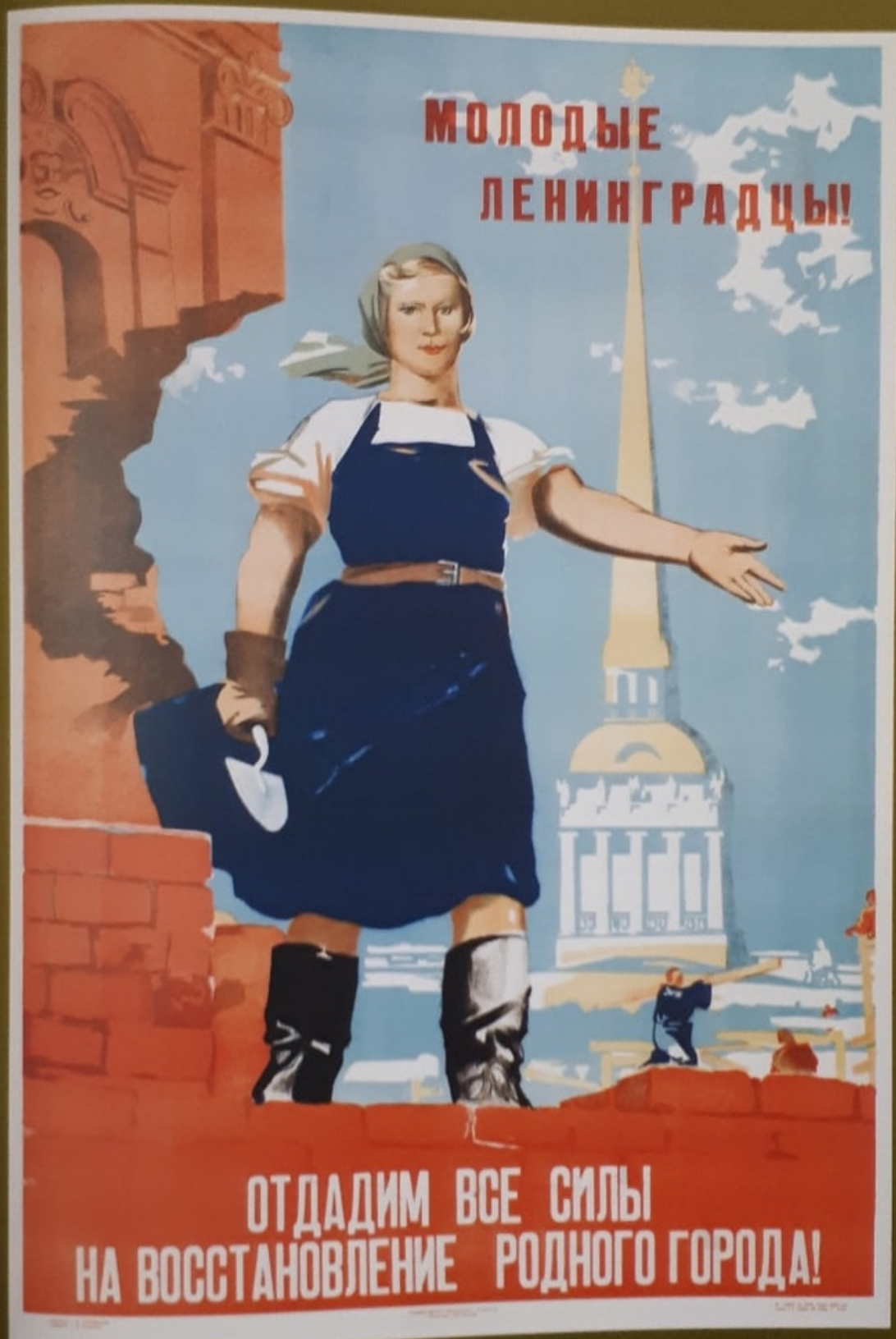
Тимофей Ксенофонов. 1944

Тимофей Ксенофонов. Молодые ленинградцы. 1944. Холст, масло. Музей истории Ленинграда.