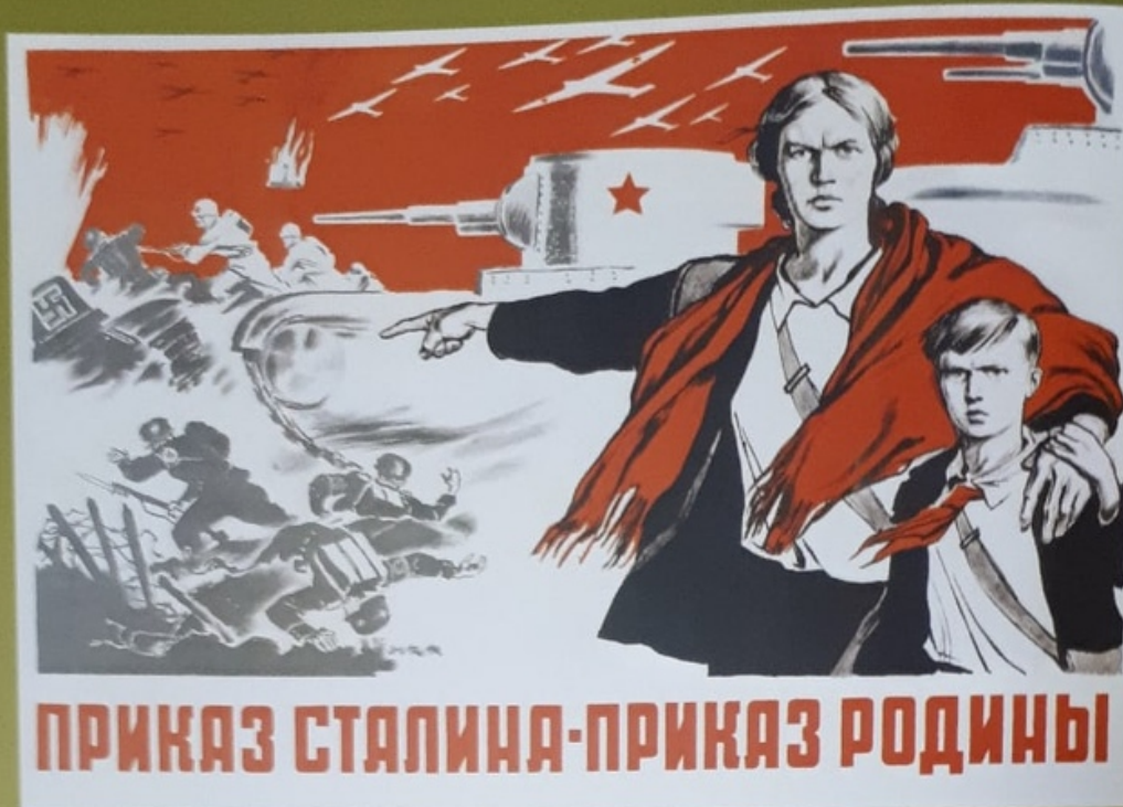
164 Владимир Серов. 1942 Vladimir Serov Stalin's Order is the Motherland's Order Leningrad-Moscow, 1942