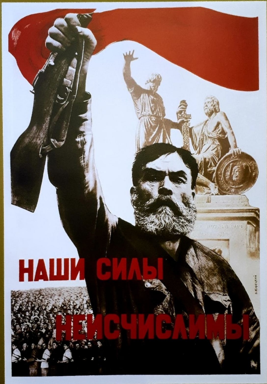
5 Виктор Корецкий. 1941 Viktor Koreckiy Our Forces are Infinite Moscow-Leningrad, 1941