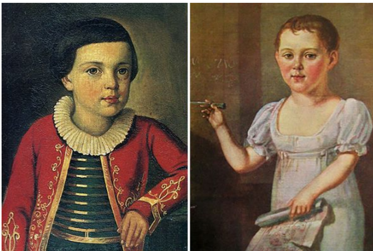
Михаил Лермонтов в детстве

В сентябре 1828 года Михаила Лермонтова зачислили в 4-й класс столичного университетского пансиона. В декабре мальчика перевели в пятый класс, подарив за прилежание картину и книгу. Этот год знаменателен тем, что Лермонтов от него отсчитывал начало творчества.