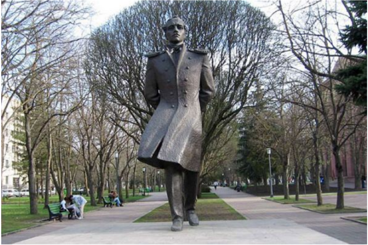
Памятник Михаилу Лермонтову в Ставрополе