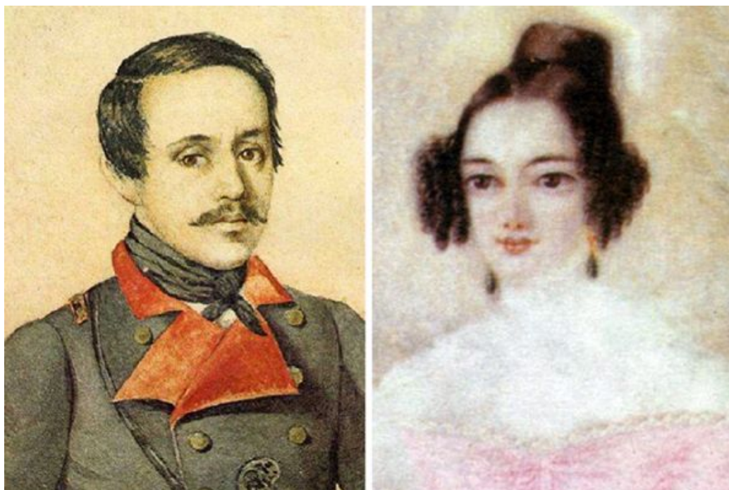
Михаил Лермонтов и Екатерина Сушкова

Поэт, по описанию современницы-барышни, красотой не отличался. Мал ростом, коренаст, взгляд черных глаз мрачен, улыбка недобрая, нервный юноша, похожий на избалованного и злобного ребенка.