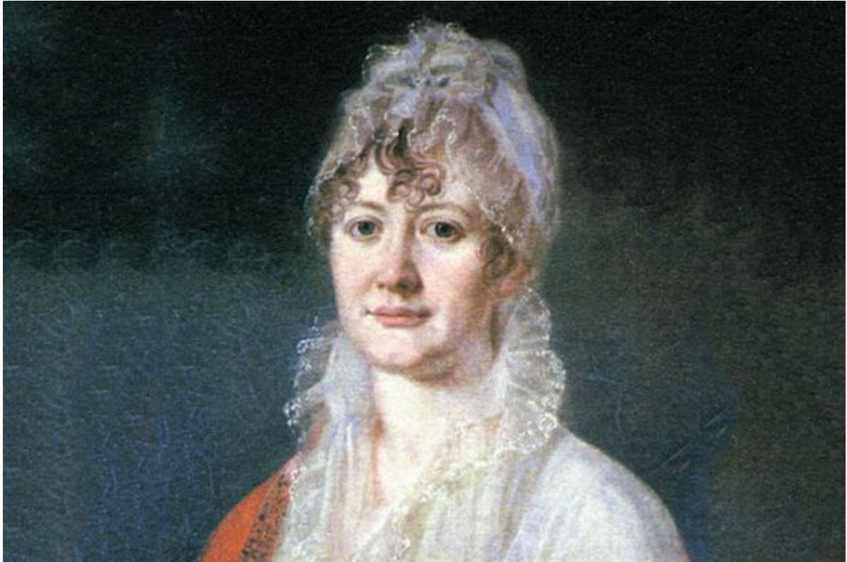
Елизавета Арсеньева, бабушка Михаила Лермонтова

Отцу властная теща изредка позволяла встречаться с сыном, от чего страдали оба.