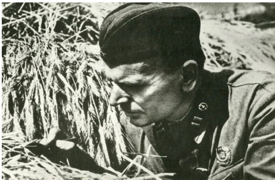
Паустовский на Южном фронте, 1941 г.

Вскоре решением комитета искусств Паустовского с семьей эвакуировали Алматы, какое-то время он провел в Барнауле. Большую часть войны Константин Георгиевич занимался творчеством, трудился над художественными работами. Из-под его пера вышла пьеса на актуальную тему «Пока не остановится сердце». В тот же период он подготовил несколько рассказов, работал над романом «Дым отечества».