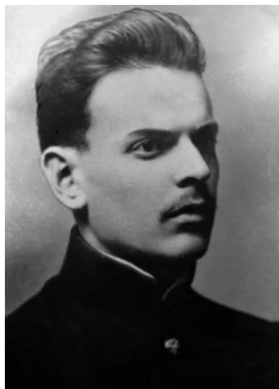
Гимназист Константин Паустовский

Первая Мировая, которая началась чуть раньше прибытия Паустовского в Москву, смешала все карты. Россия оказалась в сложнейшем положении. Казна стремительно пустела, уровень жизни населения даже в центральной части страны начал неуклонно и существенно падать. Не обошло стороной обнищание и семью писателя.