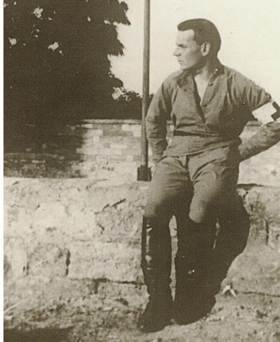
К. Паустовский санитар, фото 1915 г.

Чтобы свести концы с концами Паустовскому пришлось оставить университет и устроиться на работу. В течение всего-то одного года он сменил несколько постов: вожатого, кондуктора трамвая, затем санитаря на поездах. В последнем качестве Паустовский повидал театр боевых действий. Побывав на европейских фронтах.