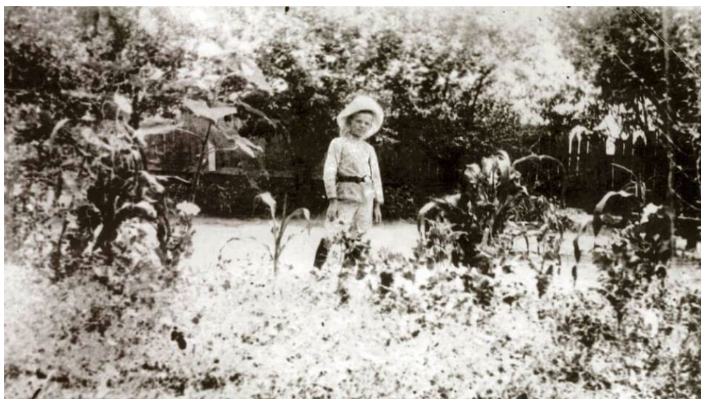
Константин Паустовский в детстве