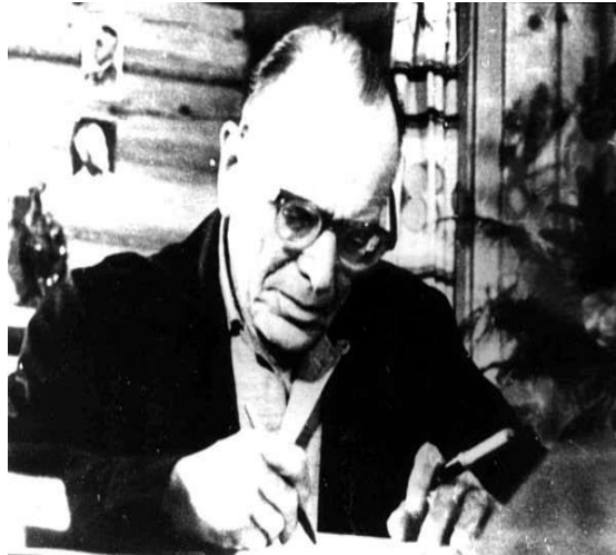
К. Паустовский за работой

страны. А когда монархия в России пала, перебрался в Киев. Тут волей случая его призвали в Красную Армию. В свое время К. Паустовский участвовал в Гражданской Войне. Хотя служба его была недолгой. Уже после окончания острой фазы братоубийственного конфликта писатель отправился в очередное путешествие. За неполные 2 года он объездил Украину, побывал на Кавказе.