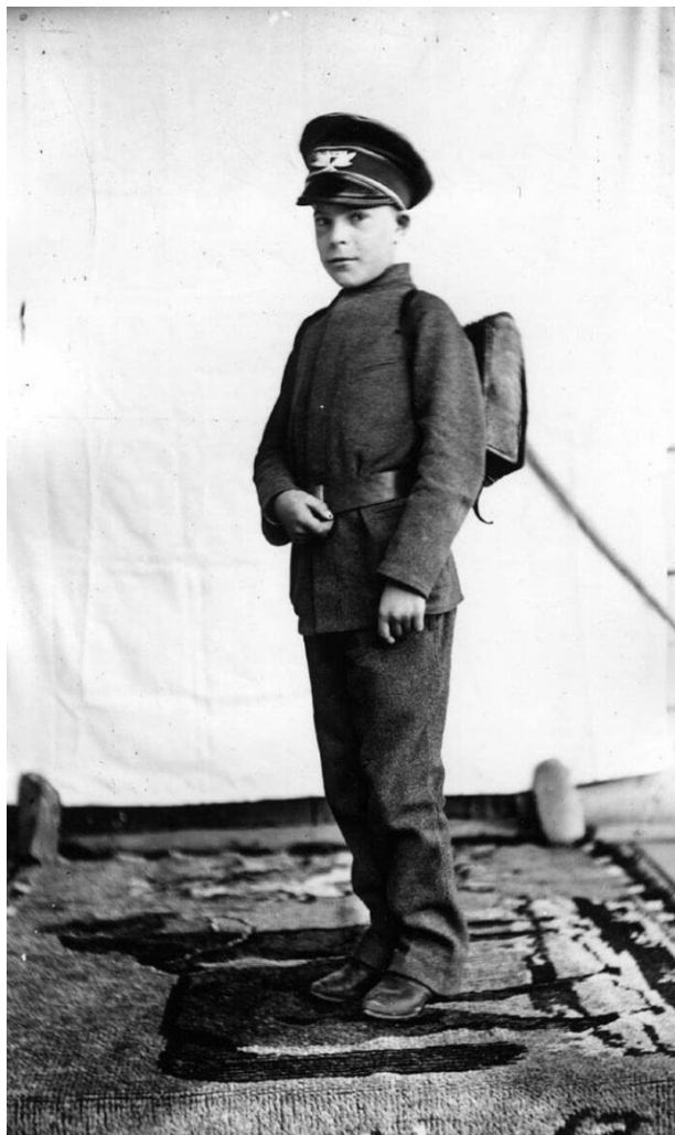
Константин Паустовский в юности

Родители Паустовского частенько конфликтовали и не находили общего языка. Из-за этого семья будущего писателя не могла похвастаться крепостью. Дружными отношения супругов назвать было нельзя.