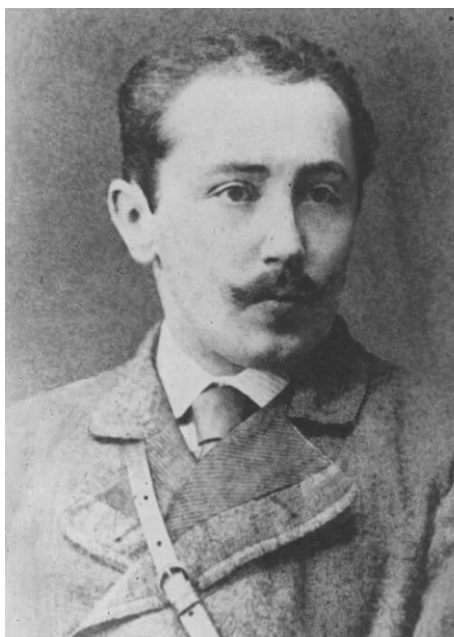
Граф Николай Александрович Толстой, отец Алексея

Молодой Толстой с детских лет много читал. Интерес к литературе мальчику привила мать. Она была неплохо образована, знала несколько иностранных языков. В зрелые годы пробовала свои силы в творчестве. Однако известной писательницей так и не стала. Критики прохладно оценивали ее литературные попытки. Все надежды женщина возлагала на сына, который проявлял живой интерес к прозе и поэзии.