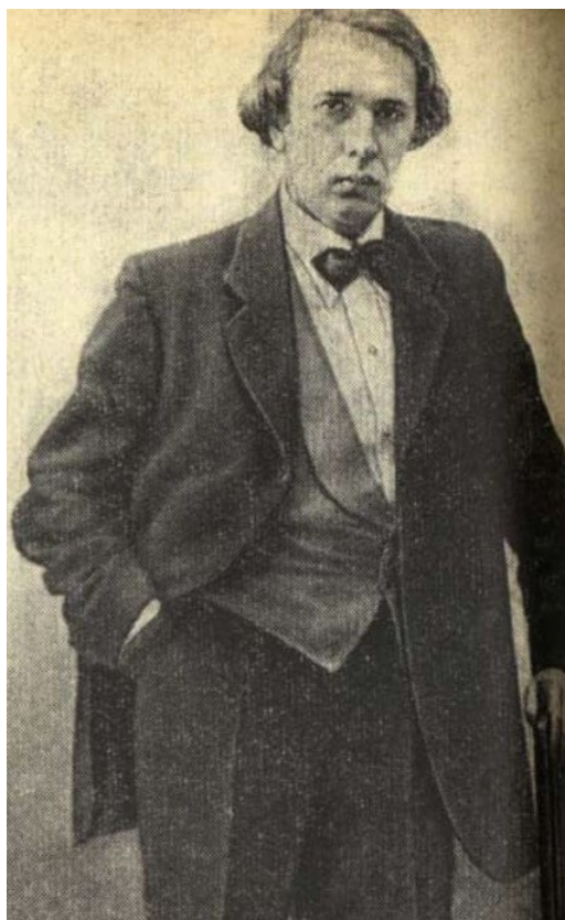
Алексей Толстой в начале XX века

Результаты не заставили себя ждать. Следом за первым сборником рассказов вышел и второй под названием «Сорочьи сказки». Начиная с 1911 года, Алексей Толстой берется за крупные литературные формы. Из-под пера на тот момент уже опытного писателя выходит роман «Две жизни». А уже в 1912-м – «Хромой барин». Литератор публиковал и повести. Прославился Толстой и как драматург. Пьесы за его авторством пользовались большой популярностью у московской публики. Спектакли ставили в Малом театре и не только. Современники поражались работоспособности писателя. Он трудился днями напролет, выпускал по несколько проработанных произведений в год. Помимо литературной деятельности, Толстой находил время на то, чтобы посещать выставки. Не пропускал ни одной театральной премьеры. В 1914-м начинается Первая мировая Война. Из-за проблем со здоровьем на фронт писателя не взяли. Не попав под мобилизацию, Толстой не стал сидеть сложа руки. Он сосредоточился на журналистике и публицистике. Работал в качестве военного корреспондента. Неоднократно