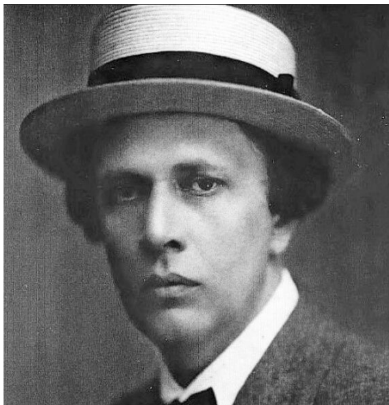
А. Толстой в начале писательской карьеры

Несколькими годами позже на свет появились произведения, объединенный мотивом русского фольклора. Стихотворения Толстого, однако, отклика ни в широких массах, ни в среде критиков не нашли. Его обвиняли в подражательстве, в первую очередь Некрасову. С 1911 он больше не прикасался к поэзии. Вскоре после дебюта, Алексей Толстой берется за прозу. Он пробует свои силы на малых литературных формах. Меньше чем через год в свет выходит сборник рассказов под общим названием «Заволжье». Начинающий писатель удостоивается высоких оценок критиков. Его дебют встречают благожелательно. Хорошее мнение о творчестве начинающего литератора высказывал сам Максим Горький. Однако сам Толстой оставался недоволен результатом. Он нещадно критиковал себя. Прозаик был настоящим перфекционистом. После успешного дебюта, чтобы не слыть неучем и дилетантом, он взялся за выработку собственного литературного языка. Такого, чтобы его творчество не спутали ни с чьим другим.