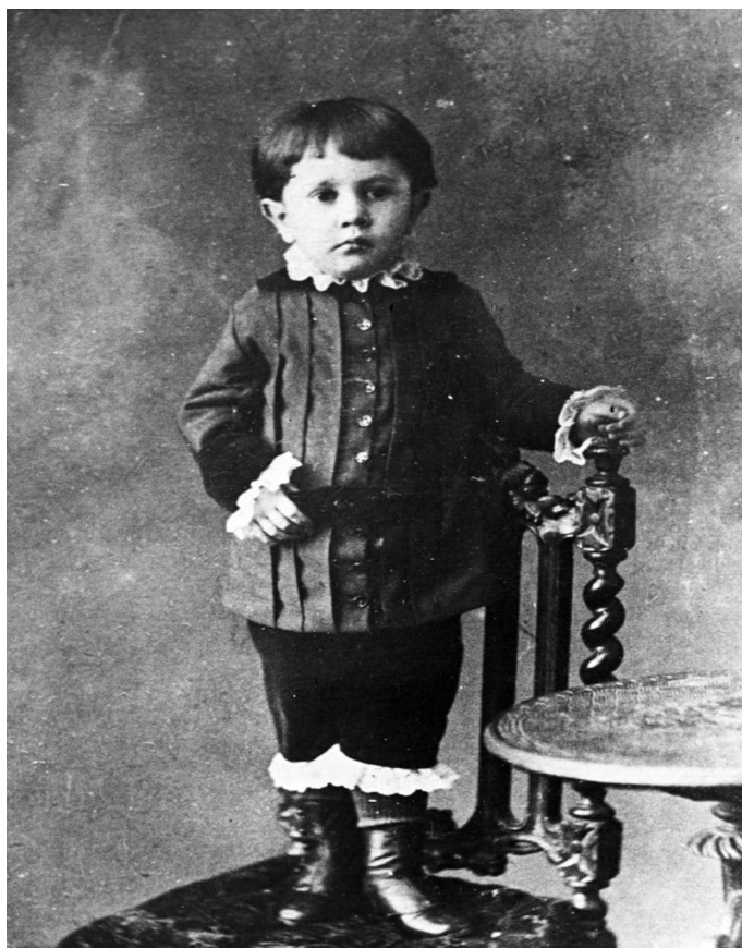
Алексей Николаевич Толстой в детстве