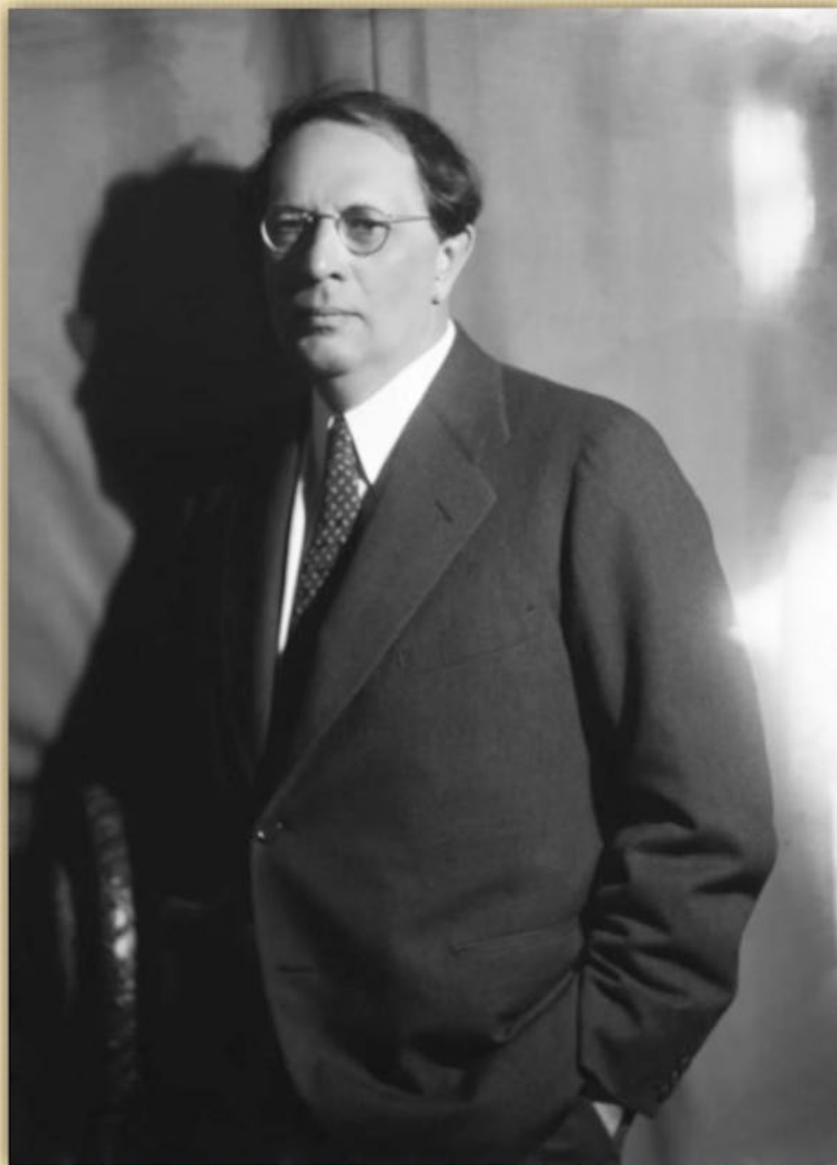
Алексей Николаевич Толстой (1883 - 1945)