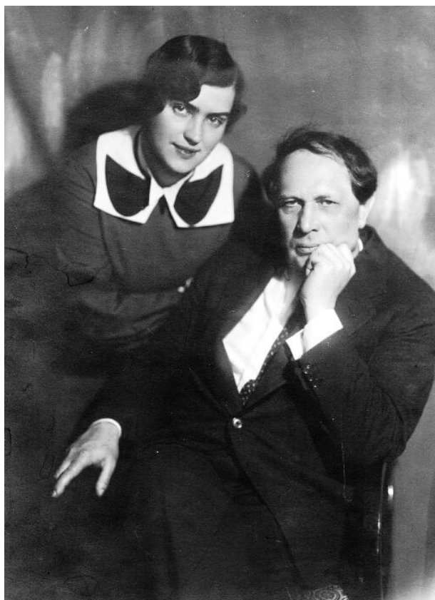
Алексей Толстой и Людмила Ильинична